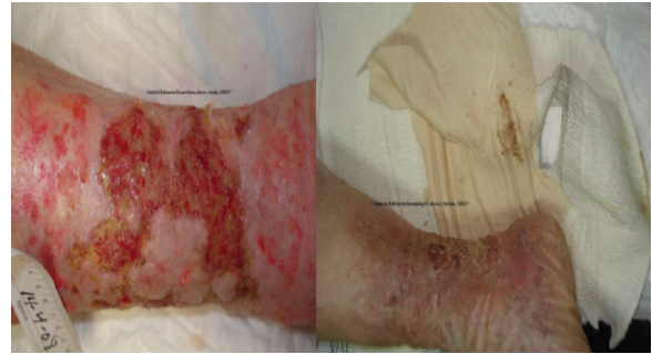
Herida antes y después del tratamiento con apósitos de quitina.