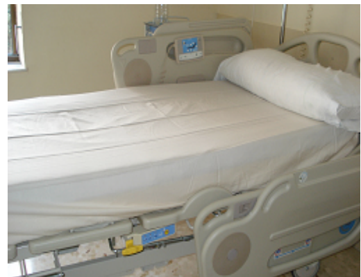
Habitación con sábana Quitina